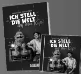
Ich stell, die Welt auf den Kopf CD 94949, € 19,- Ich stell die Welt auf den Kopf Liederheft 85766, € 8,-