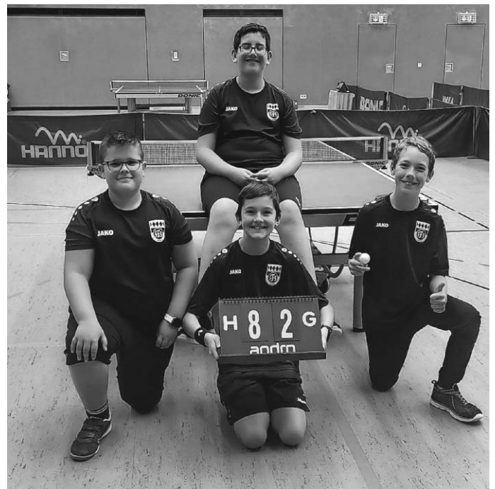
Jungen U14 II